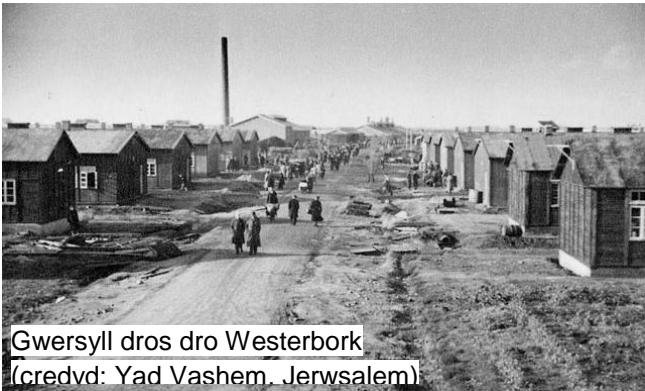
Gweryll dros dro Westerbork

Anfonwyd cyfanswm o 547 'sipsi' i Westerbork. Fodd bynnag, ar ôl ymchwiliadau pellach gan awdurdodau'r gweryll, daeth yn amlwg nad Roma oedd dros eu hanner er eu bod yn byw mewn wagenni, neu roedd ganddyn nhw basportau tramor, ac felly fe gawson nhw eu rhyddhau o'r gweryll. Rhoddwyd y 245 o Sinti a Roma oedd yn weddill ar drên gwartheg ac fe'u cludwyd i Auschwitz-Birkenau ar 19 Mai 1944.